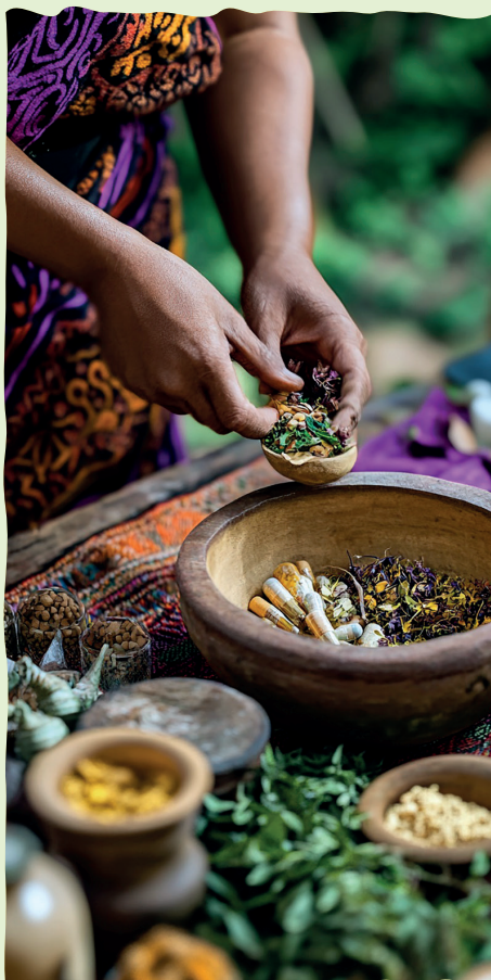
Imagem gerada por IA. Freepik.com

Você sabia que o uso de plantas medicinais é uma prática muito antiga? Desde muito tempo, as pessoas buscam nas plantas uma forma de aliviar dores e tratar doenças. Elas fazem isso de várias maneiras, por meio de chás, banhos e até com tinturas caseiras e florais. No Brasil, é comum as pessoas compartilharem receitas de plantas para curar diferentes problemas de saúde. O Chapéu-de-couro é uma dessas plantas que pode trazer muitos benefícios para a nossa saúde. Ela ajuda a prevenir problemas de pele, do fígado e das vias urinárias. Isso acontece porque ela tem propriedades anti-inflamatórias, anti-reumáticas e também funciona como diurética, ou seja, ajuda o corpo a eliminar líquidos.