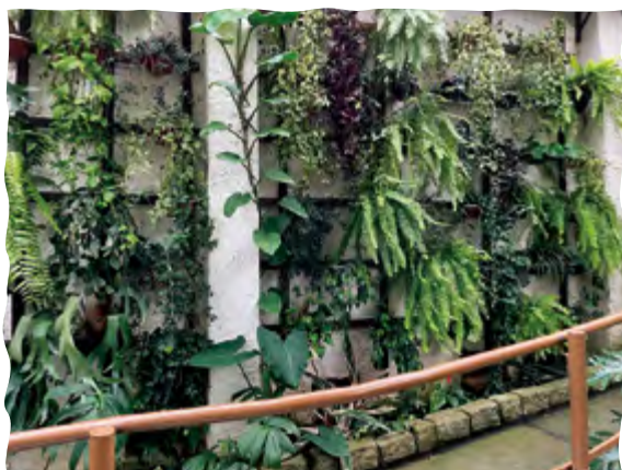
Jardim na parede.