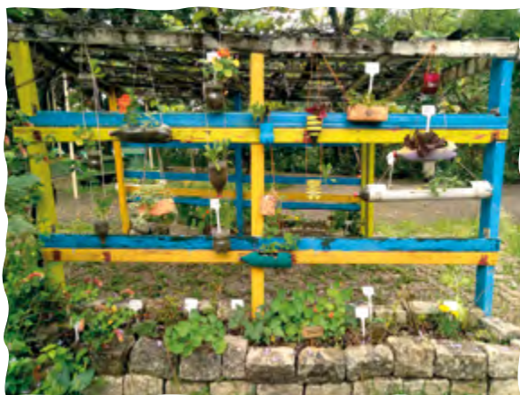
Jardim em estrutura vertical.

Para montar é muito simples. Só precisa de uma estrutura ou parede que receba luz solar e de vasos de plantas, que podem ser comprados ou feitos de materiais reutilizáveis, como garrafas pet ou caixas de leite. Depois é só pendurar os vasos e está pronto! Fica lindo e é uma ótima forma de cultivar plantas na nossa casa, apartamento ou em locais que não tenham espaço para um jardim no chão.