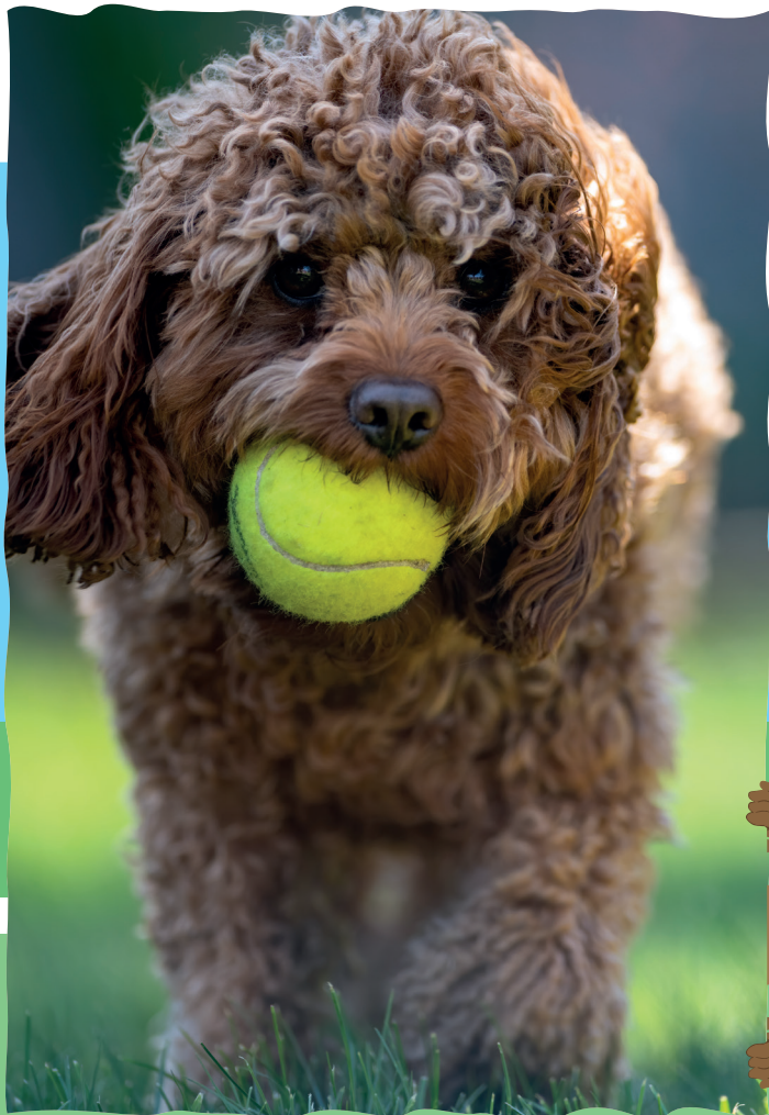
Você gosta de levar algum brinquedo na viagem? Seu bichinho também!