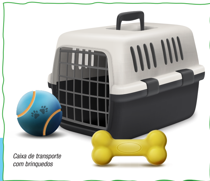
Caixa de transporte com brinquedos