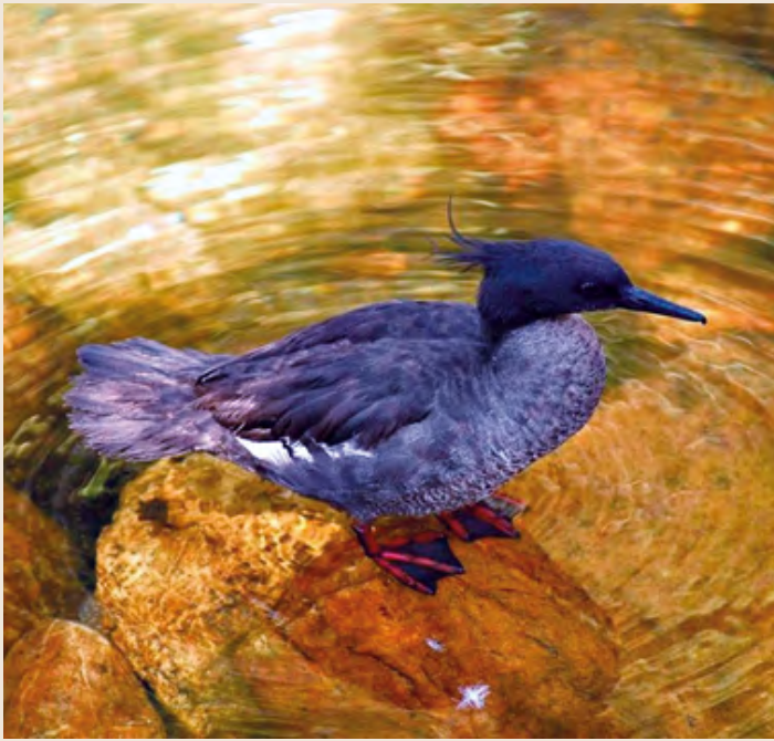
O pato-mergulhão é uma espécie exigente: só vive em rios de águas rápidas e limpas, sem vestígio de poluição; por essa razão, é um bioindicador da qualidade da água.